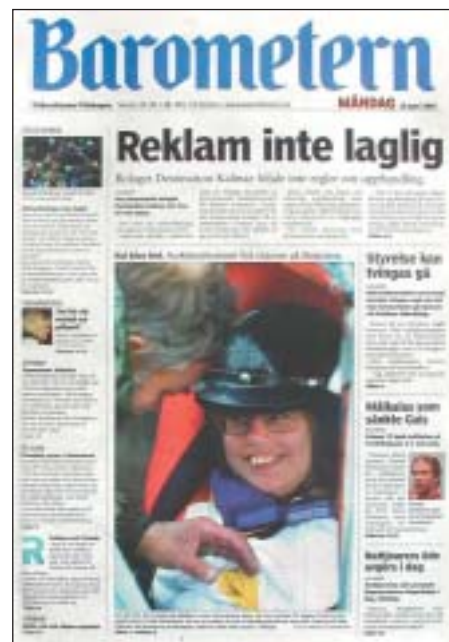
Et omfattende designprojekt for den svenske avis Barometern, der sidste år ændrede format og samtidig lavede et større typografisk skifte. Læg mærke til, hvordan Ole Munk har lavet et nyt avishoved, hvor han ganske vist har lavet en modernisering, men samtidig har forsøgt at være loyal over for avisens rødder.